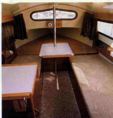
Het interieur van de Friendship 23 is geheel open en telt vijf slaapplekken. De ruit in het kajuitfront is niet standaard.

De Friendship 23 heeft een masttoptuig. Op ons testschip waren de rondhouten van Van der Neut en de zeilen van De Vries in Grouw. Alles eenvoudig, maar goed uitgevoerd. De