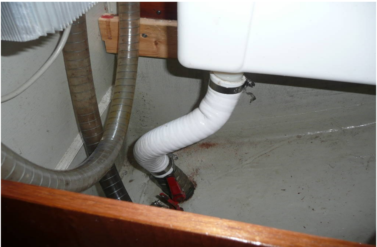
En aan de onderzijde de slang van het korte witte pijpje naar de oude afsluiter, die je alleen op zee mag gebruiken.