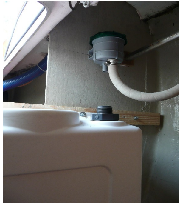
Boven de tank is plaats voor het geurfilter

Als alles gemonteerd is, kunnen tenslotte de slangen gemonteerd worden. Een feest op zich.